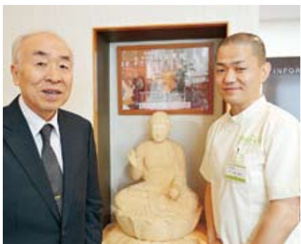
受付横の薬師如来像前で