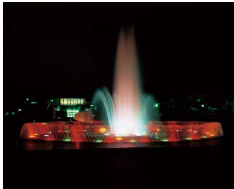
「須磨離宮のライトアップ」