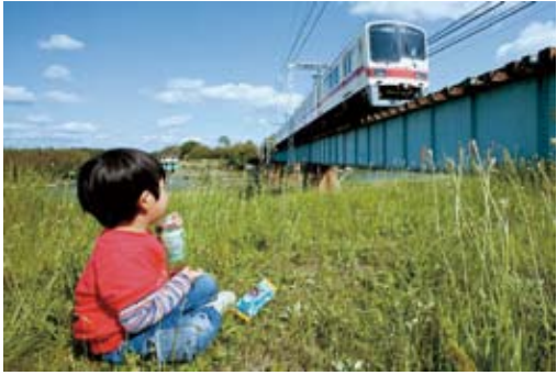
応募作品より「特等席」

常となりまし た。このこと は、地元の商店 街を衰退させ、 駅前も活気がな くなり、わが町 をさみしいもの にしてしまいま