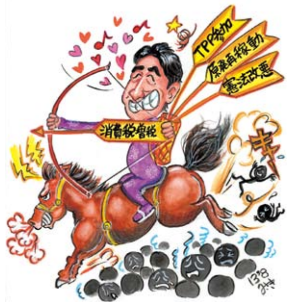
暴走馬に乗る首相