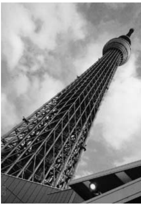
迫力満点のスカイツリー

タワーは「おのぼりさ 昇る。もちろん視界ははずばん」が行くところ、文字通りその気分満々で東京へ！東京タワーは観光施設として年間300万人が来塔しているそうである。高さは333メートル。工。総工費は当時の金額で長らく高さは日本一とされていた。