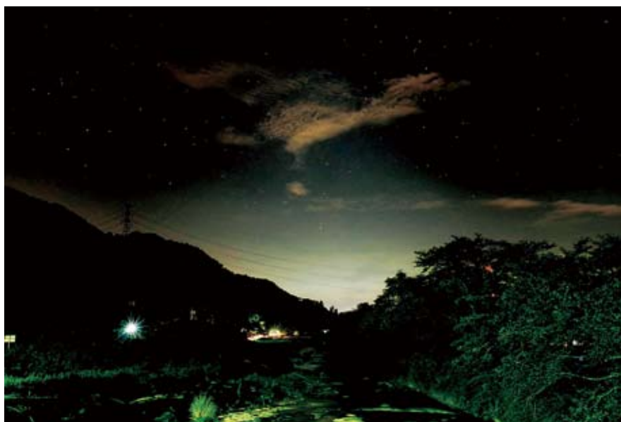
「産廃にゆれる夢前川の夜空」