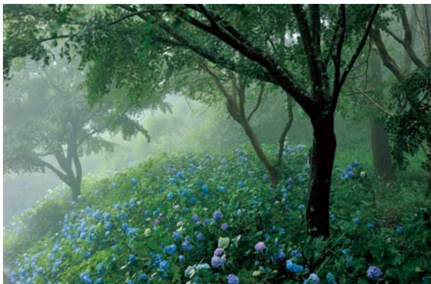
「霧の中のアジサイ群生」