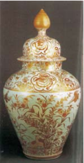
輸出古伊万里の例。色絵花鳥図大壺 『日本のやまもの』有田・九谷(講談社カルチャーブックスより)

松浦市は交通の不便な ところだが、武士団・松 浦党の城跡、朝鮮平壤の 会戦で討ち死にした領主 の供養塔、鷹島沖の海底 に眠る元寇の軍船の発見 など、見るべき史跡は多 い。