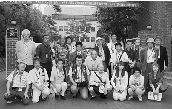
竹島聖堂前で記念撮影。後列左端が筆者

「旅」の最後に、ガイドしてくれた女性に、お礼代わりにながの憲法のことを伝えてみた。年頃の息子がいると言いつつ、戦争放棄の言葉に真剣に頷いてくれたのが印象に残る。隣人たちの悲願である平和的統一に、日本が貢献できることはいくらでもあるはずだ。韓国の反核運動との交流は、大きな成果があったように思う。今度来るときは、少しはハンゲルも勉強して行こう。いつまでも「近くて遠い国」ではない(星)