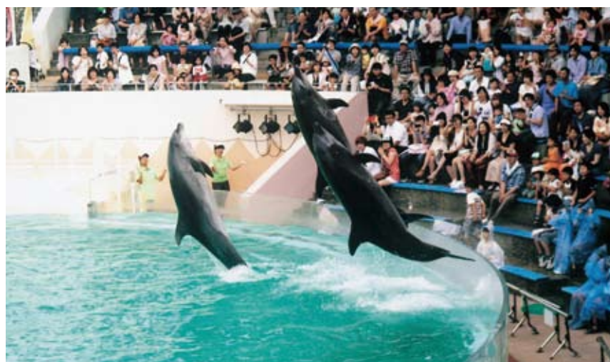
「真夏の豪快ジャンプ」