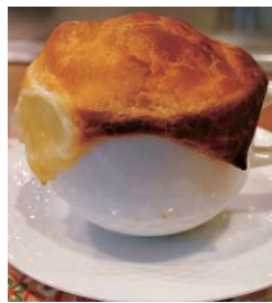
おすすめのパイ包みスープ(上)とオマールエビ(右)