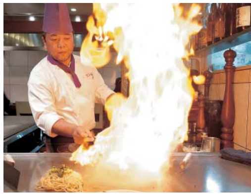
炎を上げる迫力いっぱいの鉄板パフォーマンス