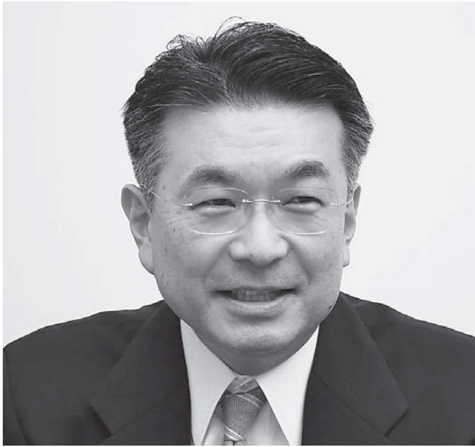
西宮市・シマダデンタルクリニック