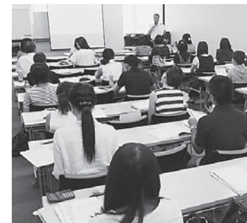
事務初心者向けに2日間かけた講習会は毎回好評

管からの吸収率が低い内服薬の抗菌剤が使用される用法が見られるが、十分な血中濃度が得られず耐性菌を生じさせるだけで効果がない場合があると指摘した。最後に、私たちが抗菌剤を適正使用しなければ、近い将来、今の子どもたちが耐性菌によって使える抗菌剤がなくなり、現在は治療できていた疾患でも救われなくなるということを意識して、抗菌剤を選択していただきたいと締めくくった。