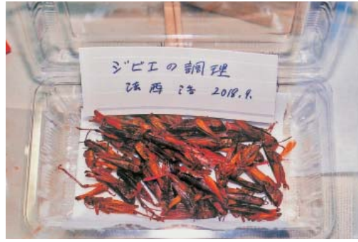
イナゴのジビエの佃煮

今は昔、75年前私は6歳。奈良県葛城村(現御所市)の母の里に疎開した。村の子どもたちとイナゴ採りをした。叔母がイナゴの佃煮を作ってくれた。その味は覚えていな