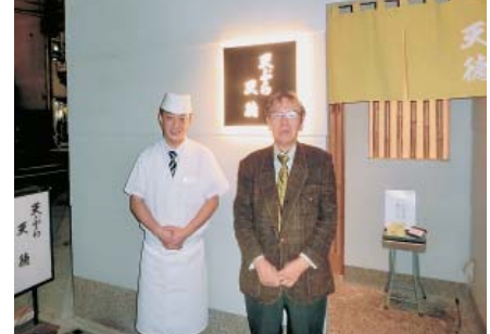
店の前で記念撮影

「天徳」 カウンター席 14席 神戸市中央区加納町4-9-14 078-331-0238 コーンス料理専門 営業時間(昼) 12~14時 (夜) 火~土曜 17~22時 日曜 17~21時30分 定休日 月曜日