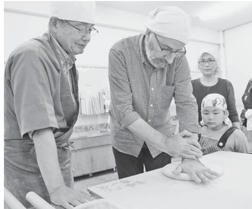
真剣な表情でそば打ちに挑戦する参加者

前回あまりにそばが美味しかったにも関わらず、自分で作る機会がなくリベンジ参加だ。 今回は当院のそば大好きオーストラリア人スタッフも(帰国後そば屋を開店すべく?)参加した。参加者の面々もバンダナを巻きエプロン