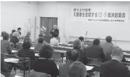
被告として裁判を闘う入居者らを激励した

借り上げ公営住宅から20年期限で被災者を追い出そうとする、神戸市や西宮市に抗議し、被告として裁判を闘う入居者らを激励する集会が、神戸市内で開催され、入居者・支援者ら約100人が参加した。