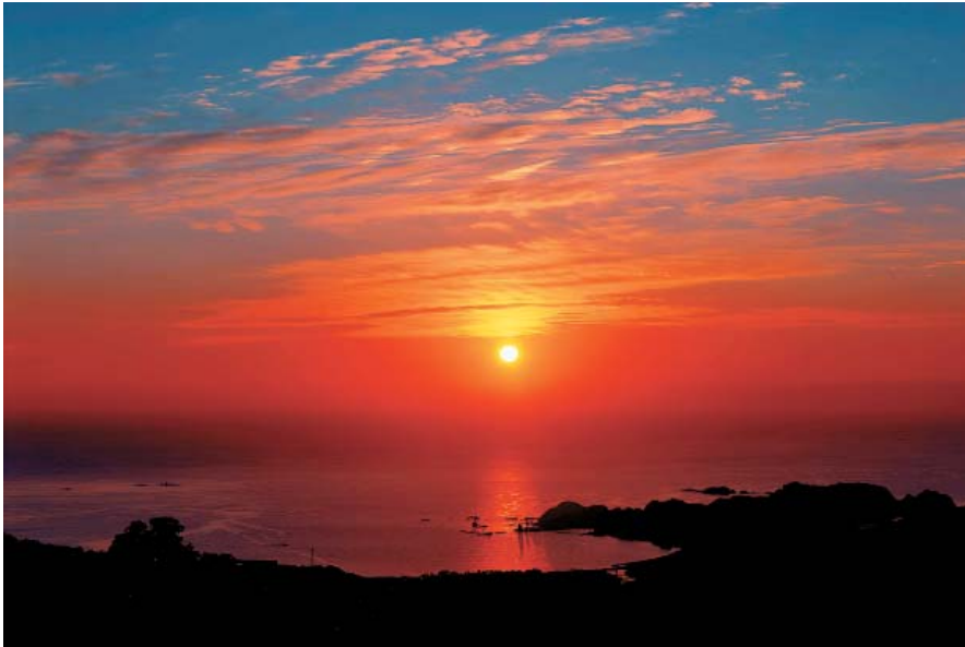
「ふだらくの朝」 須磨区・歯科 渡邊 孝