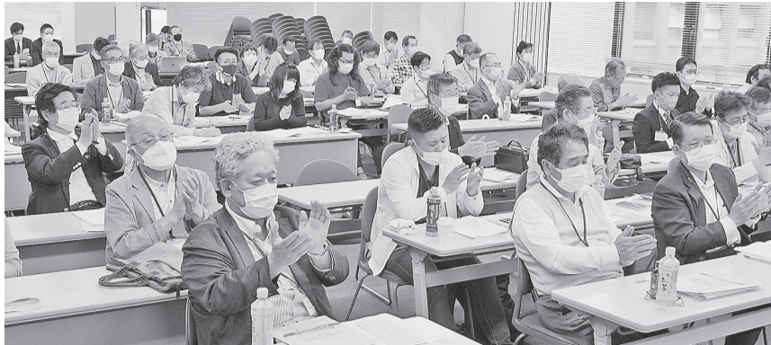
コロナ対策拡充などを求める決議案を拍手で採択

参議院選挙で社会保障の充実を実現させよう。協会は5月15日、第99回評議員会を開催。評議員ら99人が参加し、2021年度会務報告と2022年度の重点課題を承認、決議を採択した。特別講演では、