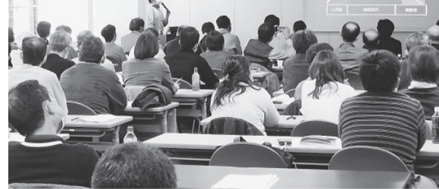
「口腔機能低下症」の診断について学習

「口腔機能低下症」の診断は、口腔機能や嚥下機能に問題がある患者さんの訪問診療を継続的に行っていく必要がある場合にも有用です。さらに、摂食嚥下障害の方への実際の現場での対応に