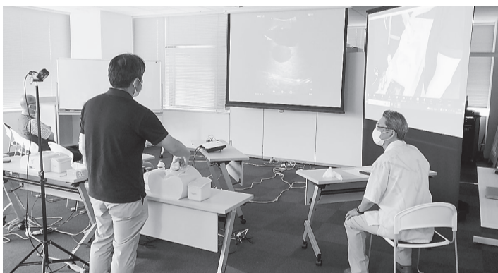
スクリーンを使って、超音波画像などを見ながら、実習を行った

だごを自分の仕事で実際に活用することができると思っています。かとの質問に、3割の先生が「全くそう思う」、7割の先生が「だいたいそう思う」と答えてくださいました。