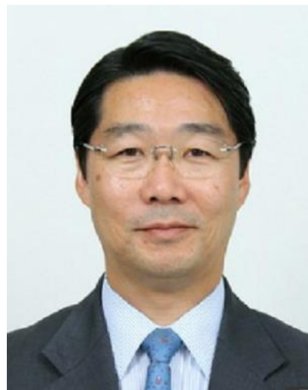
前川 喜平 氏

後援 兵庫県/神戸市/神戸新聞社/朝日新聞神戸総局/毎日新聞神戸支局/産経新聞社/サンテレビジョン/ラジオ関西