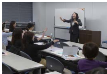
「接遇研修会」で窓口対応を磨く

また、医院経営のノウハウを学べる「医院経営研究会」では「◇スタッフ採用と定着のポイント◇職員の税と社会保険◇WEBサイト・SNS対策」など年間カリキュラムをたてて、専門家を講師に開催しています。