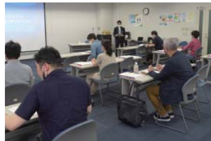
「新規開業医研」でカルテ記載等を学ぶ

また、「新規開業医研究会」を定期的開催。午前は、新規指導の指摘事項やカルテ記載とのポイントを解説。実際に新規個別指導を受けた歯科医師による体験談も好評です。午後は税務・労務の基礎知識を学べます。