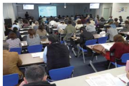
「施設基準研」で研修要件をクリア

また、診療報酬改定時には、新点数研究会を県下各地で開催。分かりやすいと好評です。