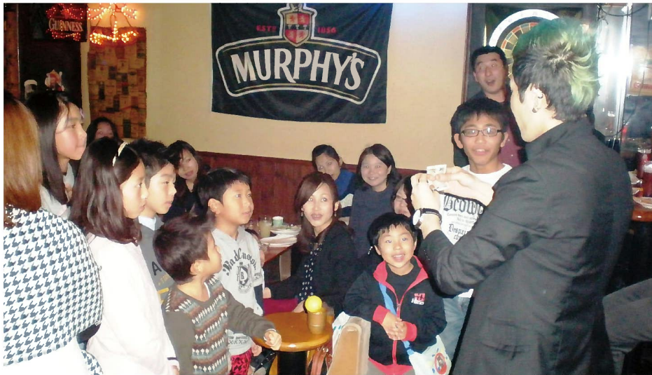
マジックに夢中の参加者たち

支部は12月21日に、明石市内の「MURPHY'S IRISH BAR」というお店で恒例となったクリスマスパーティーを開催した。会員や家族、スタッフら41人が参加した。参加者の感想文を紹介する。