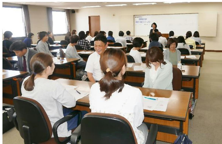
他院の参加者とロールプレイングを交えて患者接遇を学んだ

クレーム対応では「クレームの芽を摘む努力として、日頃から患者をファンにしておくことが大切。医院のファンになれば小さなクレームは事前に防ぐことができる。日々の忙しさの中に『優しさ』とスタッフの『能力』をプラスすることが大切」と解説した。