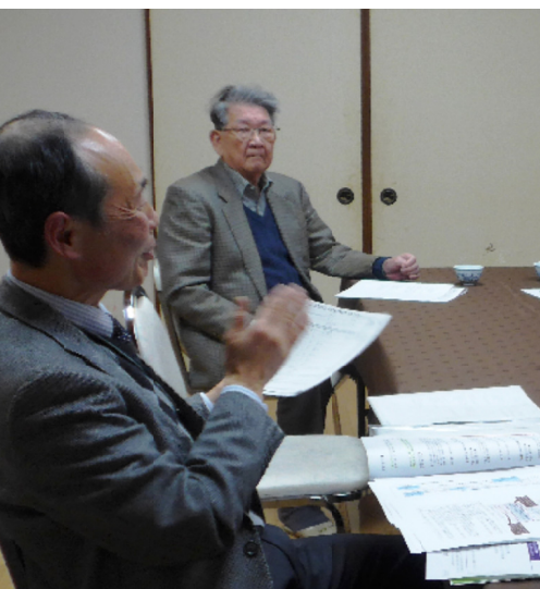
疑問点などを率直に出し合い、マイナンバー制度の理解を深めた

医療機関の対応について、2015年内はマイナンバーへの対応は必要とされないものの、年末調整用の書類などでマイナンバーが記載されている書類を預かった場合には、カギ付き金庫への保管など、紛失や漏えいが起こらないよう管理する必要があると解説した。