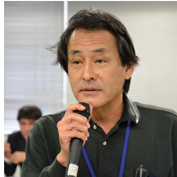
「役に立ち、頼りになる」協会を感じていただけよう、今後も医科・歯科一体の支部活動を重視し、会員