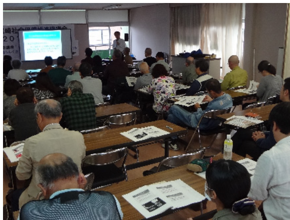
加盟団体から取り組みの報告が行われた

協会尼崎支部も参加している尼崎社会保障推進協議会の2017年定期総会が10月14日(土)に開かれた。