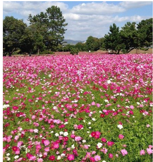
↑一昨年のコスモス園の様子(尼崎市ホームページより)。約13,000㎡の敷地に約550万本のコスモスが咲き誇る。