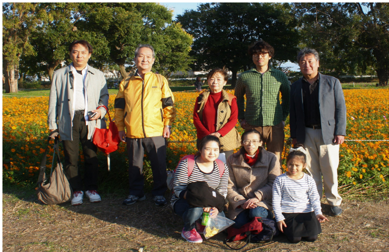
満開のキバナコスモスを背に

尼崎支部は、11月12日に「秋の武庫川ウォーク～コスモス園散策～」を開催し、会員、家族、スタッフらが阪急武庫之荘駅からコスモス園までの片道約3.5キロの行程を散策し、武庫川河川敷を彩るコスモスの花々を観賞した。