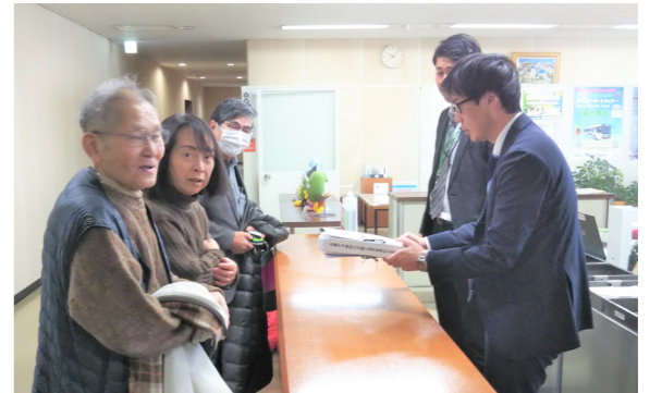
病院の存続と充実への願いを込めた署名を提出

市立伊丹病院と近畿中央病院の統合再編計画をめぐり、支部も協力した市長宛の「市立伊丹病院と近畿中央病院の存続と充実を求める要望書」と近畿中央病院院長宛の「近畿中央病院の存続と充実を求める要望書」は合計27,800筆に到達し、3月6日に「近畿中央病院の存続を求める会(以下「求める会」)」が伊丹市長、近畿中央病院長へそれぞれ提出した。