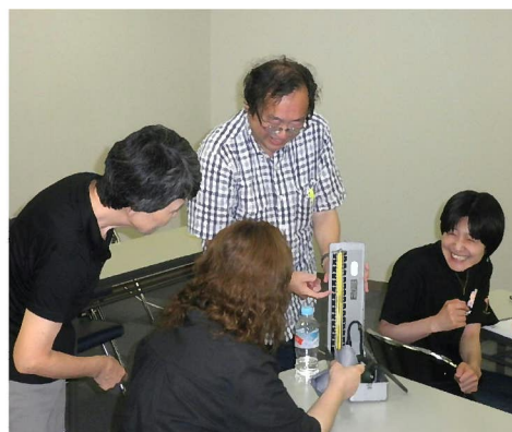
実技を交え楽しく学ぶ