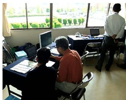
会場にはベンダー各社がデモ機を展示