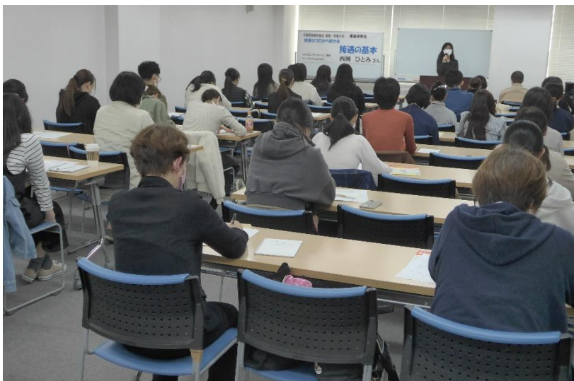
西岡氏の接遇研修を受ける参加者