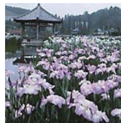
300万本の花しょうぶが 一斉に咲き乱れます