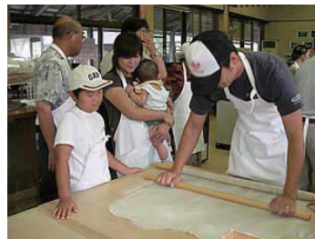
みんなでワイワイそば打ち 手作りの味を楽しみましょう

皆様、お元気でお過ごしのことと存じます。 さて、兵庫県保険医協会姫路・西播支部は、5年ぶりにバスツアー開催の運びとなりました。 今回は600年の歴史を持つ三田「永沢寺」でそば打ちを体験いただき、出来上がった自作のお蕎麦と山菜御飯、天麩羅で昼食。食後には、6月が見頃の花しょうぶ園を散策いただけます。 その後、明太子のテーマパーク「めんたいパーク」で工場見学と楽しくお買い物。最後に、「キリンビアパーク神戸」でビール工場の見学。もちろんできたてビールも試飲いただけます。 皆様のご参加をお待ちしております。