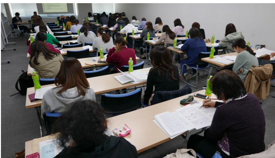
熱心に聞き入る参加者たち

2日目は、問題演習で理解を深めるため、協会作成のオリジナル問題集を使い、診療内容と請求内容を実際に記入する作業を行った。カルテの2号用紙に書かれている内容を見て、そこから3号用紙とレセプトを手書きで作成するという作業などに取り組んだ。