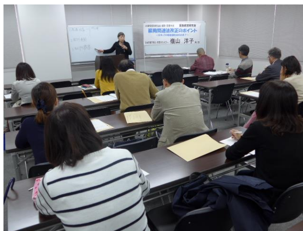
豊富な具体的事例から雇用管理を学んだ

有給休暇の付与は義務となり、罰則もありますので、必ず取得してもらおうよう従業員に話すつもりです。