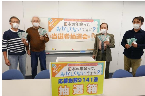
抽選は協会事務所で担当役員により行われている