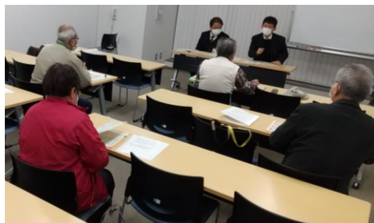
職員の報告を熱心に聞く参加者

姫路市の職員は退職後の健康保険は国保と社保を選択できることや、収入が減少した際に保険料を減免する制度があることを説明。国保の一部負担金の減免制度についても概要を報告した。