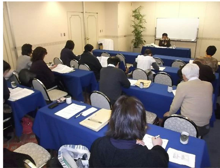
講師の話に熱心に耳を傾ける参加者ら

参加者からは「地域の医療、介護関係者もこうした制度の利用法をよく知らない。ぜひ、周りの関係者に伝えて、多くの患者さんを救いたい」などの感想が寄せられた。