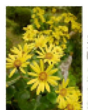
琵琶湖・貴生産のワイン

お問い合わせは、兵庫県保険医協会明石支部担当事務局(TEL078-393-1807) 平田・本田までどうぞ。