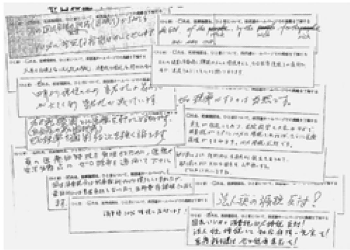
協会に寄せられたたくさんの意見

患者負担と医療機関の損 る会員署名を開始し10月20 税を増やす消費税増税は中 日現在372筆が寄せられ 止を。協会は、消費税 た。明石支部の会員からも 10%への増税中止と医療・ 19筆が寄せられた。「ひと 生活必需品に、ゼロ税率免 言」欄には受診抑制の実態 税)を適用することを求め や増税による経営難を訴え る切実な声、大企業減税へ の怒りの声がかかれてい る。集まった署名は10月23 に役員が上京し、財務省な どに提出する。寄せられた 支部会員の声を紹介する。