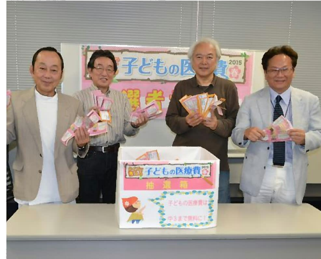
担当役員が約5千通から当選者を抽選

・県下で中学生まで医療費無料がこんなにあるとは知らなかった。引越しの参考にもなりました。 (45歳 男性) ・ちょうど新居購入を考えていました。医療費無料マップを参考にして、検討したいです。兵庫県は本当に住みやすいと思います。ママ友にも紹介したいです (49歳 男性)