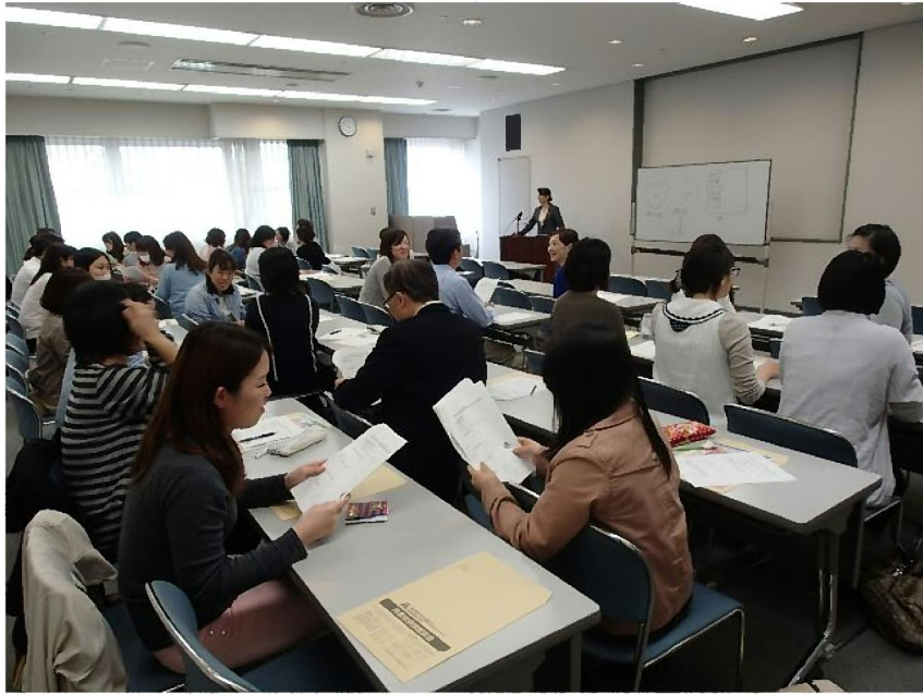
講演後、カルテの開示を患者から求められた場合の対処など、参加者から質問が相次いだ

それからクレームに対する心構え、対応の基本の話がありました。クレームにマイナスイメージをもっていと対応が遅くなってしまうと思います。クレームは貴重な情報源であり、ご指摘、ご要望と捉えて積極的に向き合っていくことで患者さまの信頼を回復することになり、自らのレベル向上につながっていきます。クレーム対応のプロセスやケーススタディの際、いくつかの具体的な言い回しがとても参考になりました。まずは謝罪から入る。そのときに相手が怒っていることを取り上げて、それに対して謝罪する部分謝罪をする。私は思い返せば、謝罪よりもついこちら側の言い分を