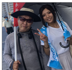
明石市内を行進する 榎林支部幹事(左)