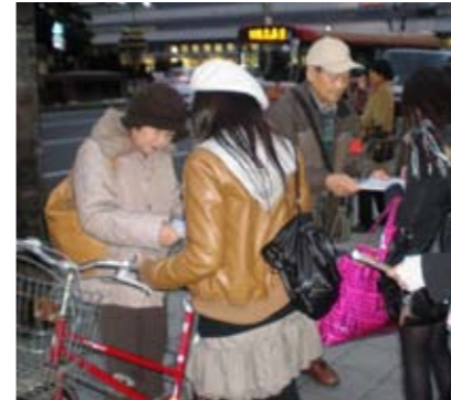
若い人たちが次々に署名した

保険料の年金天引き日にあたる2月15日、協会も加盟する西播社会保障推進協議会(西播社保協)は、後期高齢者医療制度の即時廃止を求める宣伝・署名行動を実施。24人が参加し、1時間で104筆が集まった。「いよいよ私も後期高齢者や」「早く何とかしてほしい」などという切実な声が出され、道行く人が次々署名の呼びかけに応じた。