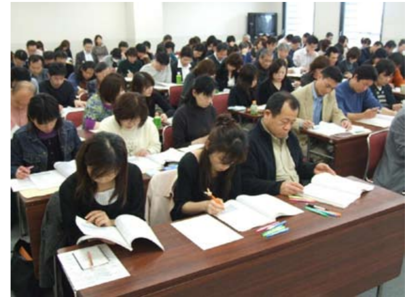
前回改定時に行われた新点数研究会

診療報酬改定の4月実施に伴い、県下で改定研究会が開催される。姫路でも3月22日(月・祝)に歯科研究会、27日(土)に医科診療所と病院の研究会を予定している。