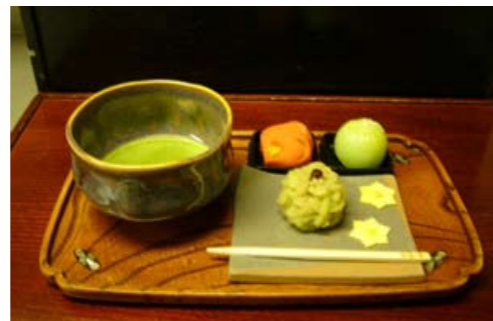
作った和菓子をお抹茶といただきます