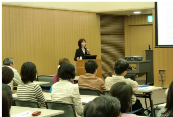
今回で6回目となる研修会に38人が参加した