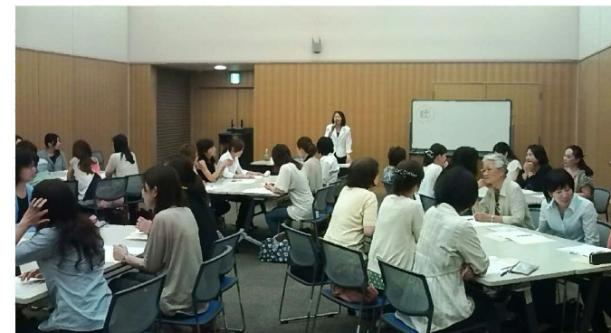
会場いっぱいの35人が参加 (6/22)

意見が聞けて良かったです。(歯科受付) ★初対面の方とのディスカッションは緊張しました。時間の経過とともに少しずつ会話が出来るようになってくると、参考になる意見がたくさん出てきました。(受付事務)