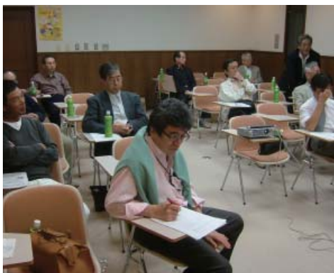
松村先生が講演(右) 12人が参加し意見交換した(左)