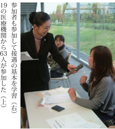
参加者も参加して接遇の基本を学習(右) 19の医療機関から63人が参加した(上)