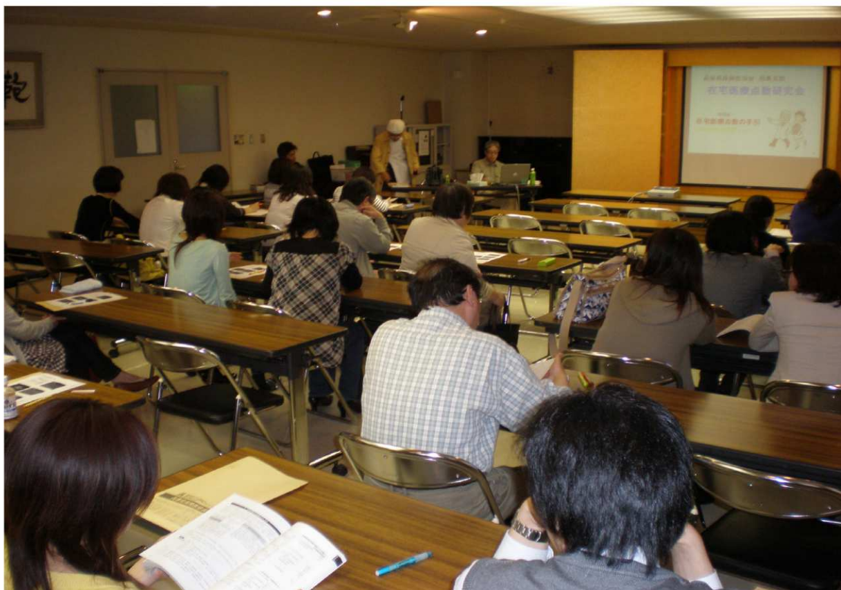
医師、スタッフら多数が参加した

但馬支部は、4月18日に豊岡かばん協会会議室（じばさん但馬ビル5階）で「在宅医療点数研究会」を開催し、会員やスタッフなど32人が参加した。