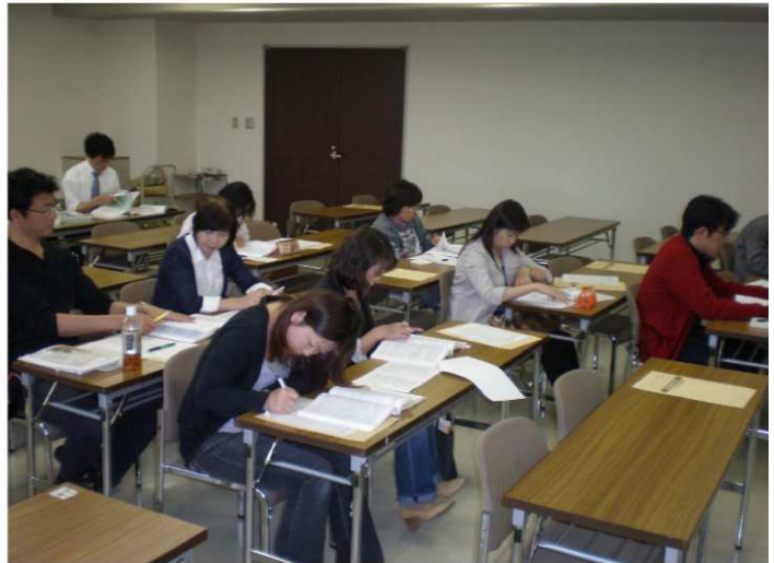
熱心に聞き入る参加者

保団連では、介護労働者が結婚して子育てができる賃金と労働条件が保障されるよう、全てのサービスについてさらに2%以上の報酬上乘せを求めるとともに、そもそも必要な介護の公的給付を制限する区分支給限度額を廃止するなど抜本的な制度の改善を要望している。