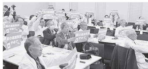
「薬の追加負担は許さない！」とアピールする集会参加者

厚労省は、今回の減算について、質上げや物価高対応に診療報酬改定財源の多くが振り向けられる中で、減算により「メリハリ」をつける形になったと述べた。また、精神保健指定医の資格の有無で診