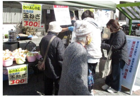
かけあしの会からは定番の物産品に加え、新鮮な玉ねぎの販売や、蒸し牡蠣の実演販売なども行われ、会場には多数の市民が訪れた

西宮・芦屋支部は3月14日(土)、西宮市の広川内科クリニックと林医院の2箇所で開催。被災地交流／物品・物産展を開催。気仙沼に本拠地をおく「かけあしの会」による東北の物産販売にくわえ、一昨年の能登半島地震被災地や、戦時下のウクライナから寄せられた物品・作品を販売した。また、協会の行っている被災地訪問・線量測定の記事、震災アスベスト問題、パレスチナ・ガザ地区に居住する被災者の方々の日記や、日本に住むクルド人の方々