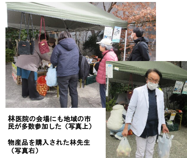
林医院の会場にも地域の市民が多数参加した(写真上)