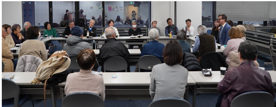
終了後は軽食を囲みながら講師と参加者による意見交換会も開催。「本当の勝利とは何か」など、ウクライナの現状について参加者同士で率直な意見が交わされた