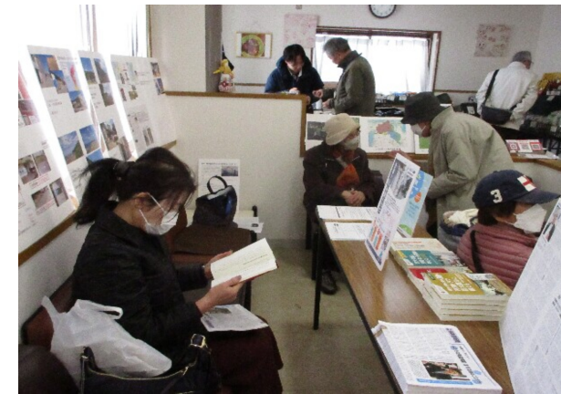
広川内科クリニックの院内では、被災地訪問の記録、パレスチナ・ガザの記録、クルド人の暮らしに関するパネルなど多数の展示も行った