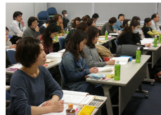
2月の講習会には90人が参加し学習した

協会は会員医療機関のスタッフ研修として「初心者のための保険請求事務講習会」を開催し好評を得ている。西宮・神戸・姫路などで開催しているが、神戸では2月に今年度4回目を開催した。毎回定員を上回る申し込みがあり、今後4月、6月の開催も決めている。