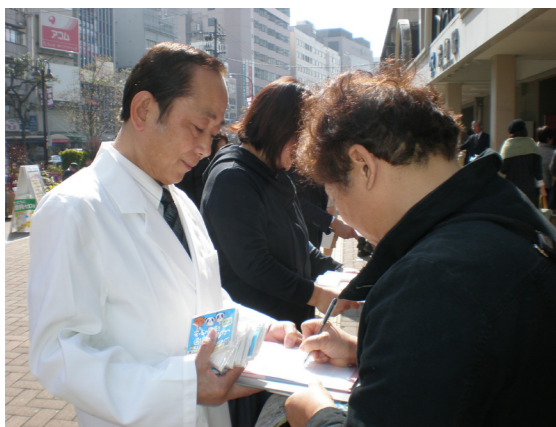
街頭行動では切実な声とともに多数の署名が寄せられた