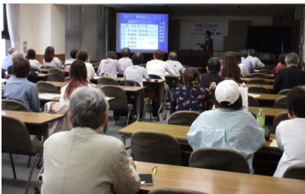
幅広い職種から37人が参加し学習した

また必要に応じ、専門職の方々へ繋げ、連携を図っていければ、より良い支援体制ができるのではないかと思います。